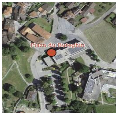
La posizione del PRU di Mezzovico-Vira