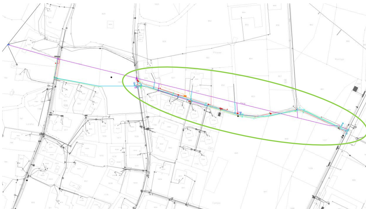
estratto piano sottostrutture (nuova condotta AP indicata in blu – vecchia condotta in viola)

Sul percorso evidenziato, sono presenti le diverse infrastrutture delle aziende (elettricità, Swisscom, TV e le canalizzazioni comunali) che rendono l'esercizio della posa della nuova condotta di una certa difficoltà.