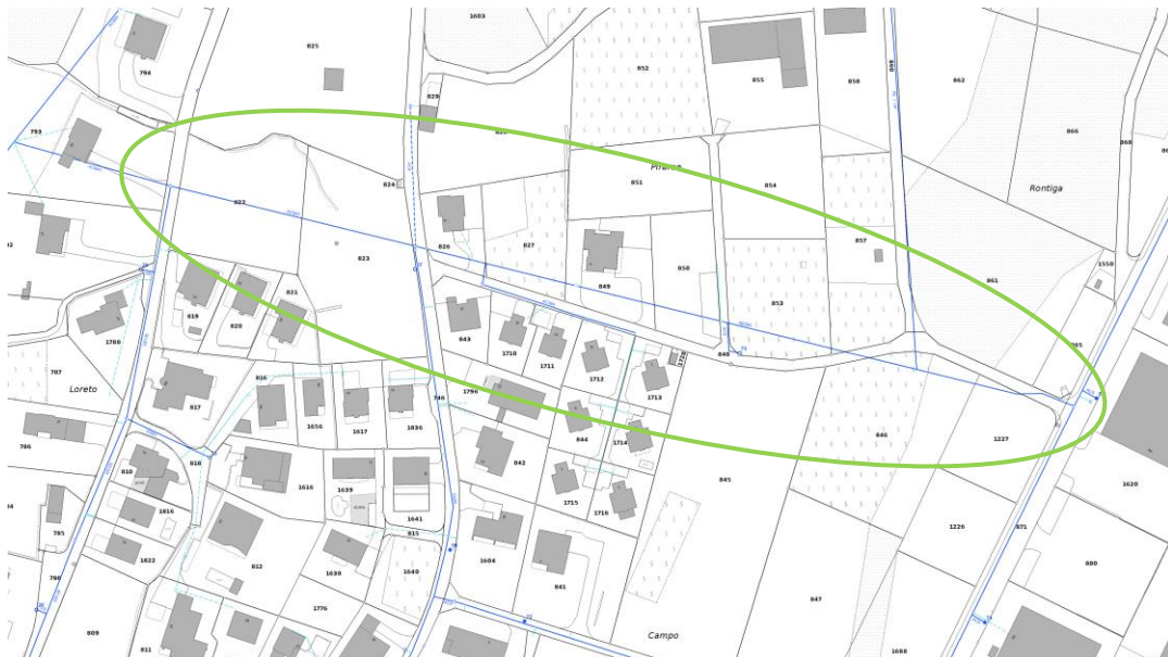
estratto rilievo AP con evidenziata la condotta interessata alla sostituzione