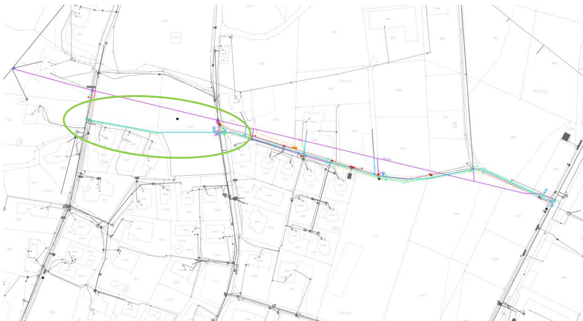
estratto piano sottostrutture (nuova condotta AP indicata in blu – vecchia condotta in viola)

Tracciato a monte di Via ai Strecc fino a Via Loreto – Il tracciato che collega Via ai Strecc a Via Loreto, è previsto attraversare due terreni agricoli di privati. Con questi abbiamo raggiunto un accordo per la concessione della necessaria autorizzazione alla posa della nuova condotta.